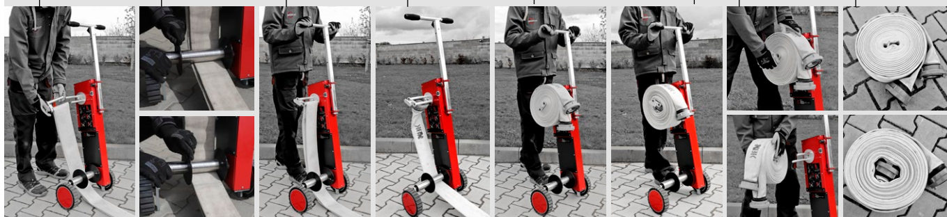
Dokonale souměrně navinutá hadice připravená k uskladnění